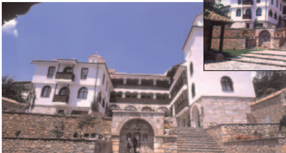
пишува: Марина ДОМАЗЕТОВСКА