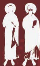
премин 9 не се сите апостоли

Втор по ред повеќедневен пост посветен на светите апостоли Петар и Павле, односно, на сите апостоли. Почнува во понеделникот по Неделата на сите свети, и трае до Петровден. Затоа и се нарекува Петров пост. Овој пост, чијшто почеток е подвижен и зависи од Велигден, е востановен во спомен на апостолите коишто после Слегувањето на Светиот Дух врз нив, а пред да заминат да го проповедаат Евангелието, постеле (Дап 13, 2-3) Апостолскиот пост може да трае најмалку една седмица и еден ден, а најдолго шест седмици. Првите сведоштва за овој пост ги сретнуваме кај Свети Атанасиј Александриски (4 век). Во Александрија, Антиохија и Ерусалим овој пост се врзувал за празникот на Светата Педесетница, а не за празникот на светите апостоли Петар и Павле, и траел една седмица. Подоцна станал подготвителен пост за празникот на светите Апостоли и неговото траење зависи од Воскресението, односно од Духовден.