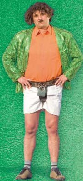
СИГУРНОСТ и ДОВЕРБА