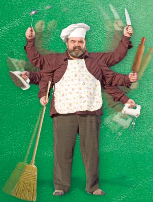
БРЗИНА и ЕФИКАСНОСТ