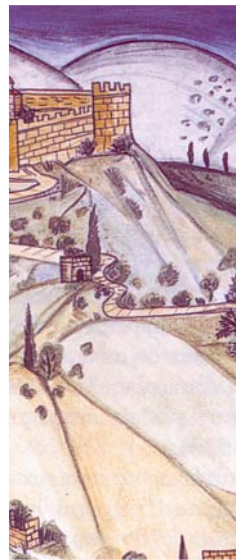
Премин, јули 2004

Критериумот за човечката смрт, престанувањето на дишењето и пулсот, сега се превозмогнува со помош на медицинската технологија за вештачко дишење и крвоток. Секој изум и ползување на техничките средства е дело на разумот и на рацете човечки. Помеѓу човекот и техничките средства постои интересна но сурова врска. Најдобра илустрација за тоа е токму реанимацијата. Таа стана олицетворение на човечките технички дострели. Надвор од вашата волја, системот на здравствената заштита со оваа техника веќе е онеспособен да се откаже од нејзината примена и поради тоа своите пациенти напати ги претвора во заложници и бесправни жртви. Со помош на медицинската технологија, границата меѓу поддршката на животот и продолжувањето на умирањето напати се брише.