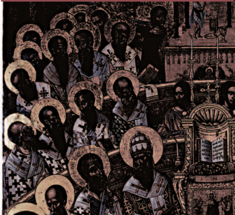
Прв Вселенски Собор

СИТЕ ПРАШАЊА ТРЕБА ДА СЕ РЕШАВААТ ВО МЕСТАТА ВО КОИШТО НАСТАНАЛЕ И ОТЦИТЕ НЕ МИСЛЕЛЕ ДЕКА БЛАГОДАТТА НА СВЕТИОТ ДУХ НЕДОСТАСУВА ВО КОЈА БИЛО ОБЛАСТ